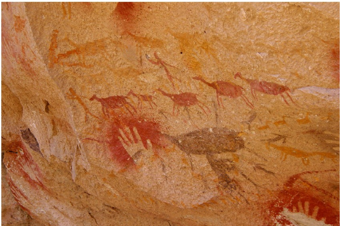
Escena de caza de guanacos en Cueva de las Manos (Río Pinturas)

Actualmente las imágenes, los dibujos, los emoticonos o emojis que empleamos a diario para la comunicación (whatsapp, redes sociales) acompañan o, a veces, hasta reemplazan a varias palabras o frases. A propósito, observá la siguiente imagen que tienen más de mil quinientos años de antigüedad: